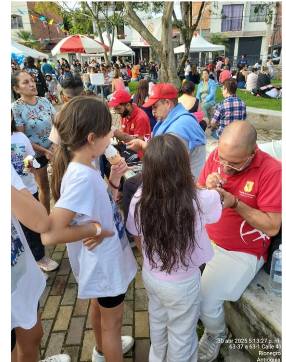
Apoyo celebración día del niño Barrio Porvenir