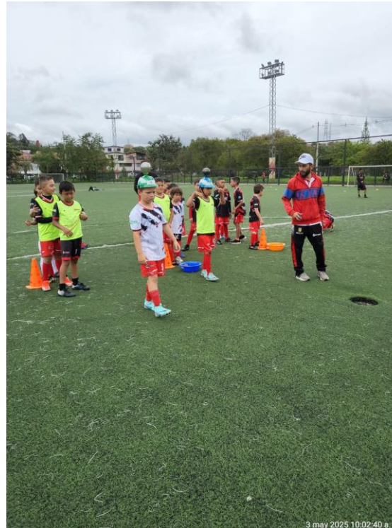
Actividad lúdico recreativa club de fútbol Real Rionegro