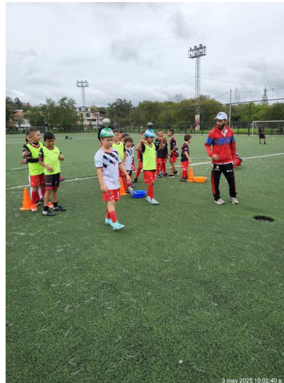
Actividad lúdico recreativa club de fútbol Real Rionegro