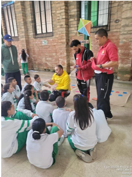
Apoyo lucha contra el trabajo infantil