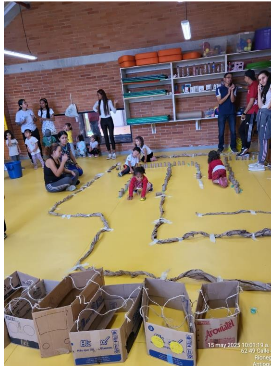
Práctica taller Indeportes en el CDI Pentagrama