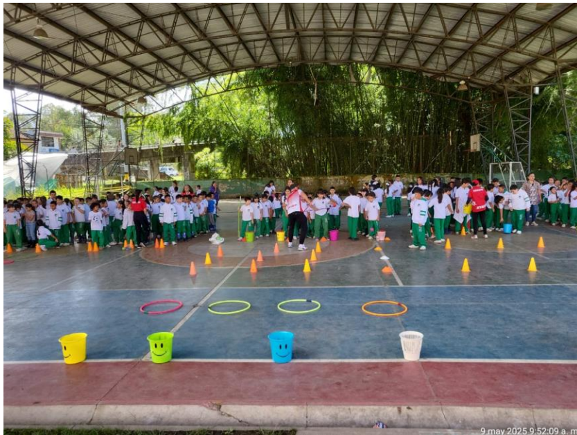
Actividad lúdico recreativa IE. Julio Sanín