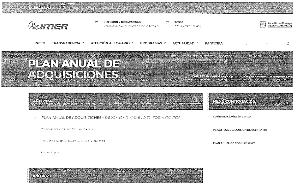
Cuadro 2: Publicación PAA en pagina web IMER

El instituto procedió con la publicación del Plan Anual de Adquisiciones en el aplicativo SECOP II dentro de las fechas establecidas de acuerdo con la Circular Externa n.º 2 de 2013 de Colombia Compra Eficiente.