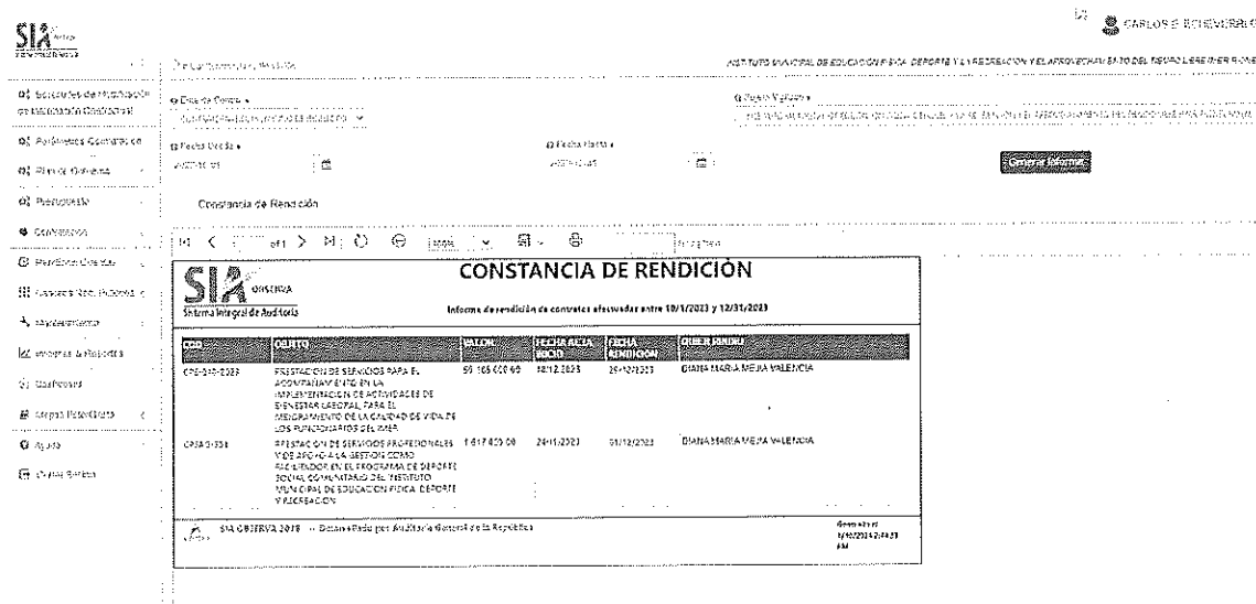
Cuadro 1: Constancia de rendición.

Fuente: Aplicativo SIA Observa, Informes- "Informe constancia rendición".